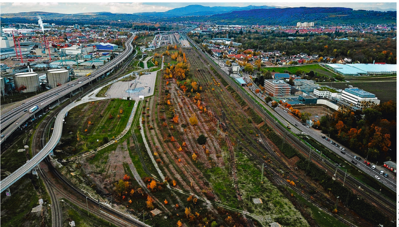
Noch ist das Naturschutzgebiet und TWW-Objekt «Badischer Bahnhof» ein wertvoller Lebensraum und eine grüne Lunge mitten im Siedlungsraum. Doch mit dem Projekt Gateway Basel Nord mit Hafenbecken 3 droht es, nahezu vollständig überbaut zu werden.

Offensichtliches wirkliches Ziel des Gateway Basel Nord ist ein riesiges zentrales